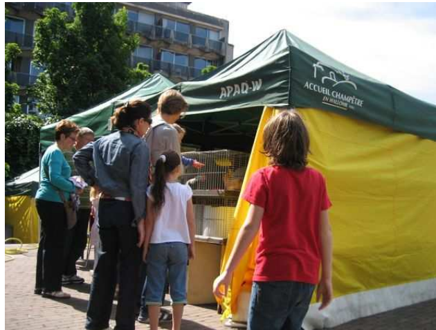
TONNELLE DES VOLAILLES...

ICI MEME, LA FERME ROB, CHAUSSEE DE L'OURTHE, NOUS FAIT DECOUVRIR TOUTS LES PRODUITS LAITIERS ISSUS DE SA PRODUCTION JOURNALIERE, LAIT, MAQUEE, BEURRE... DELICIEUX ! NON LOIN ENCORE, LA FERME WALHIN DE AYE ET SES FROMAGES ARTISANAUX..., LE MARAICHER ET SES LEGUMES DE SAISON. IL Y EN A POUR TOUTS LES GOUTS !