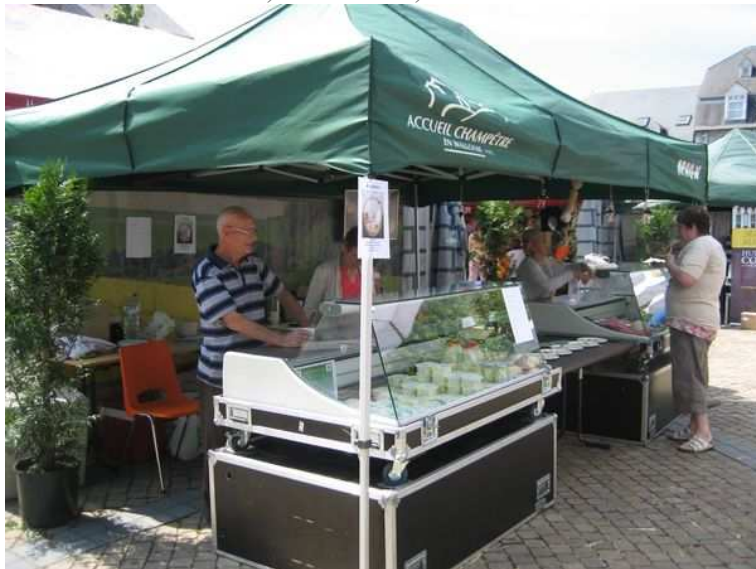
TONNELLE DU LAIT, FROMAGE, BEURRE...

ICI MEME, LA FERME ROB, CHAUSSEE DE L'OURTHE, NOUS FAIT DECOUVRIR TOUTS LES PRODUITS LAITIERS ISSUS DE SA PRODUCTION JOURNALIERE, LAIT, MAQUEE, BEURRE... DELICIEUX ! NON LOIN ENCORE, LA FERME WALHIN DE AYE ET SES FROMAGES ARTISANAUX..., LE MARAICHER ET SES LEGUMES DE SAISON. IL Y EN A POUR TOUTS LES GOUTS !